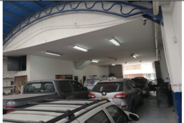
Fotografía No 4. Vista general del establecimiento