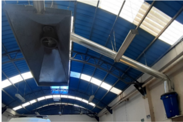
FOTOGRAFÍA No 9. Campana, ducto y caneca.