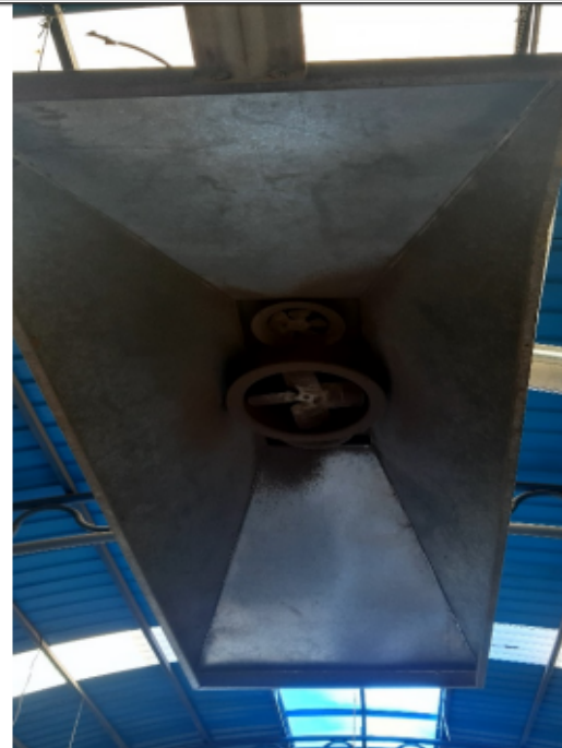
FOTOGRAFÍA No 12. Campana con sistema de extracción.