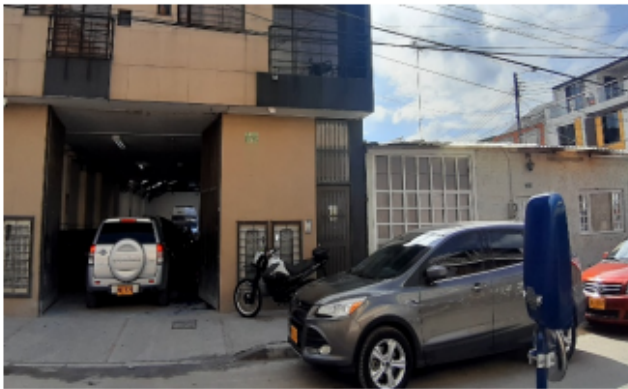
FOTOGRAFÍA No 3. Uso del espacio público.