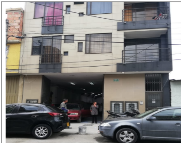
Fotografía No 1. Fachada predio