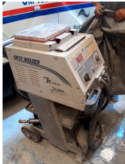
FOTOGRAFÍA No 8. Spotter (Saca golpes)