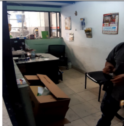
FOTOGRAFÍA No 4. Oficina