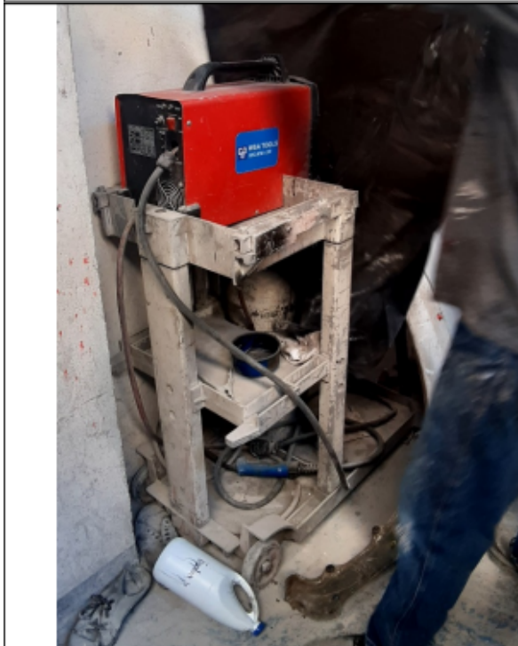
FOTOGRAFÍA No 7. Equipo de soldadura