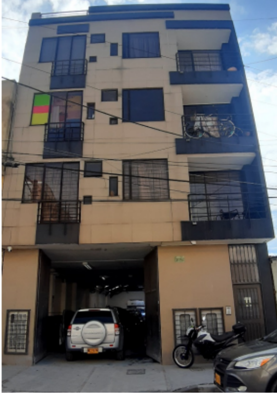
FOTOGRAFÍA No 1. Fachada del predio.