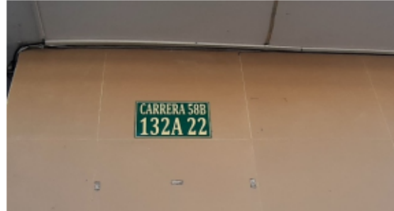
FOTOGRAFÍA No 2. Nomenclatura urbana del establecimiento.