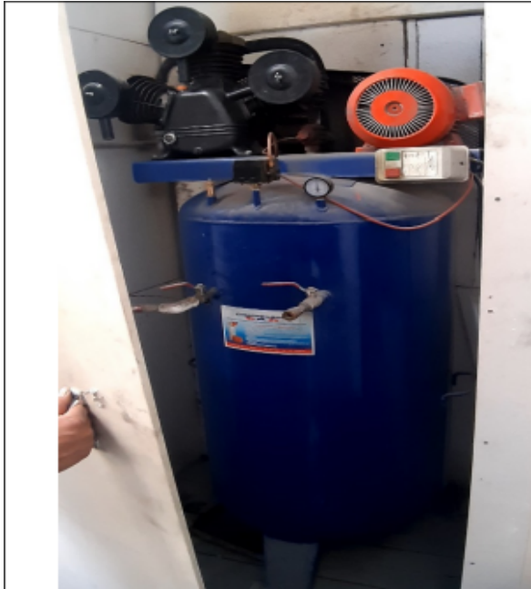
FOTOGRAFÍA No 5. Compresor