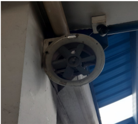
FOTOGRAFÍA No 11. Extractor # 2