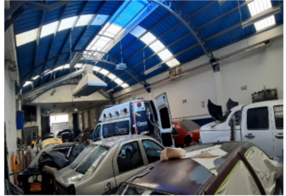
FOTOGRAFÍA No 6. Interior del establecimiento