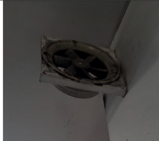
FOTOGRAFÍA No 10. Extractor # 1