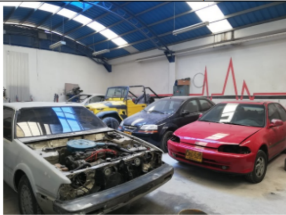
Fotografía No 3. Vista general del establecimiento